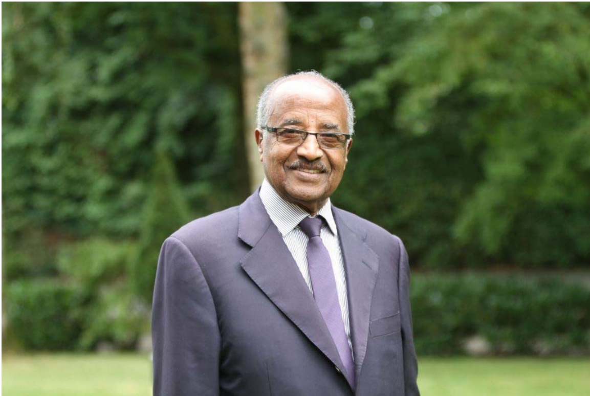
Eritreas Außenminister Osman Saleh Mohammed im Juli 2019 in Münster/ Westf.

ASMARA/ MÜNSTER. Im Juli 2020 versandte Ulrich Coppel schriftliche Fragen an Eritreas Außenminister Osman Saleh. Es war als ein „Nachgehakt“ hinsichtlich eines Interviews gedacht, das im Oktober 2019 in den WESTFÄLISCHEN NACHRICHTEN veröffentlicht worden war. Wichtige grundsätzliche Themenfelder, wie der eritreische Nationaldienst, die Entwicklung einer Verfassung, aber auch Aktuelles, wie der Stand der Beziehungen zwischen Deutschland und Eritrea und COVID wurden thematisiert.